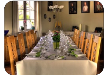
"Hjemme hos middag"