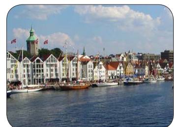
Stavanger havn Vågen

Vel møtt til spennende dager i Stavanger i august 2012.