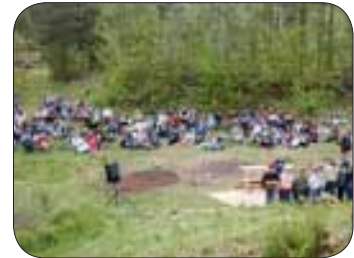
Grilling på Horve leirsted